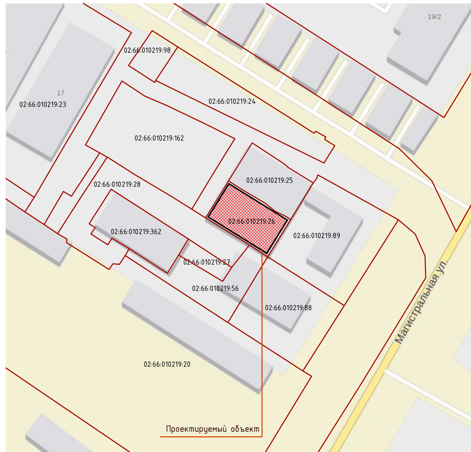
Ситуационный план М 1:1000