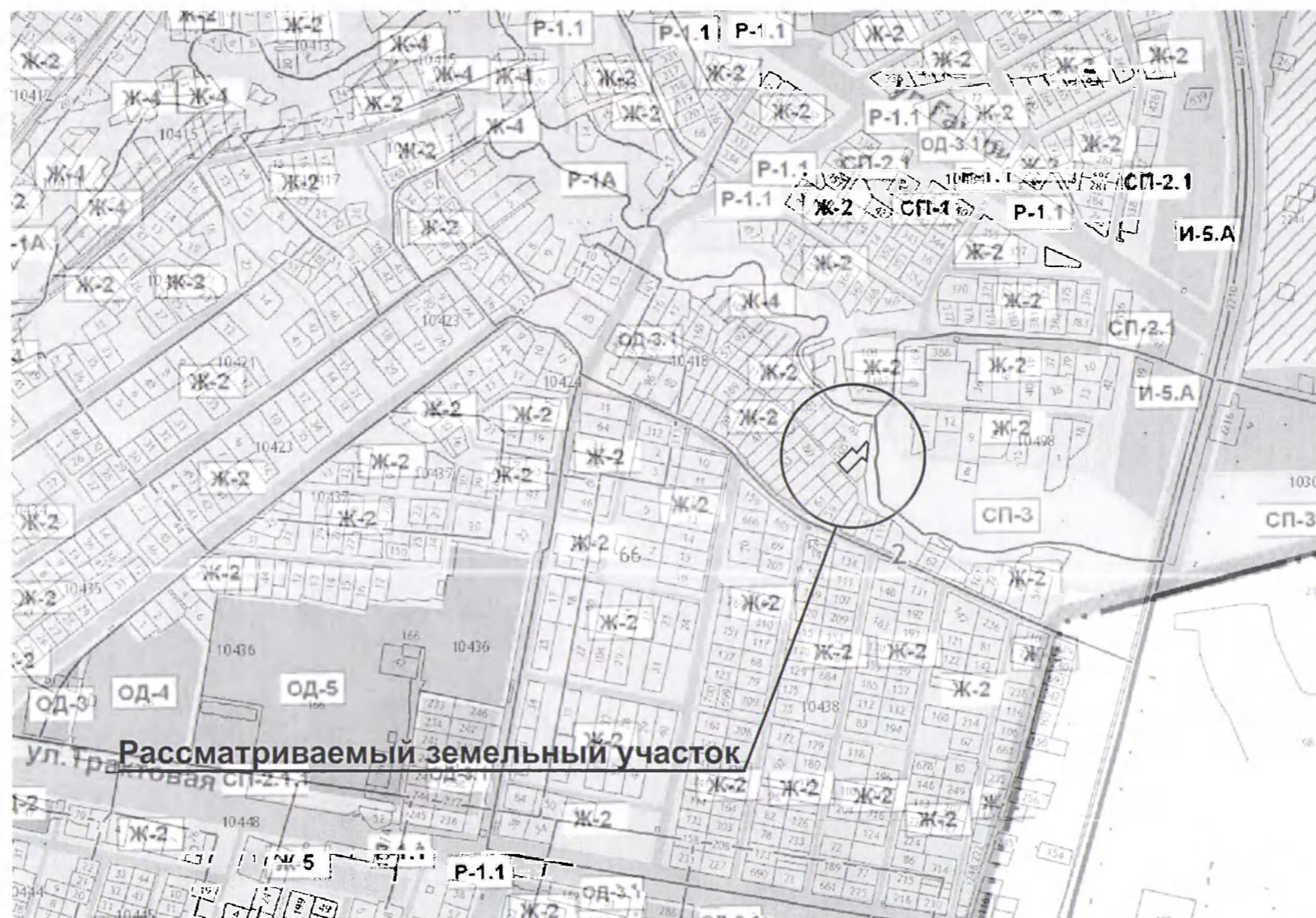
Схема расположения земельного участка с кадастровым номером 02:66:010418:86 по адресу: городской округ город Нефтекамск, СНТ «Клубничка», уч. 49 для индивидуального жилищного строительства